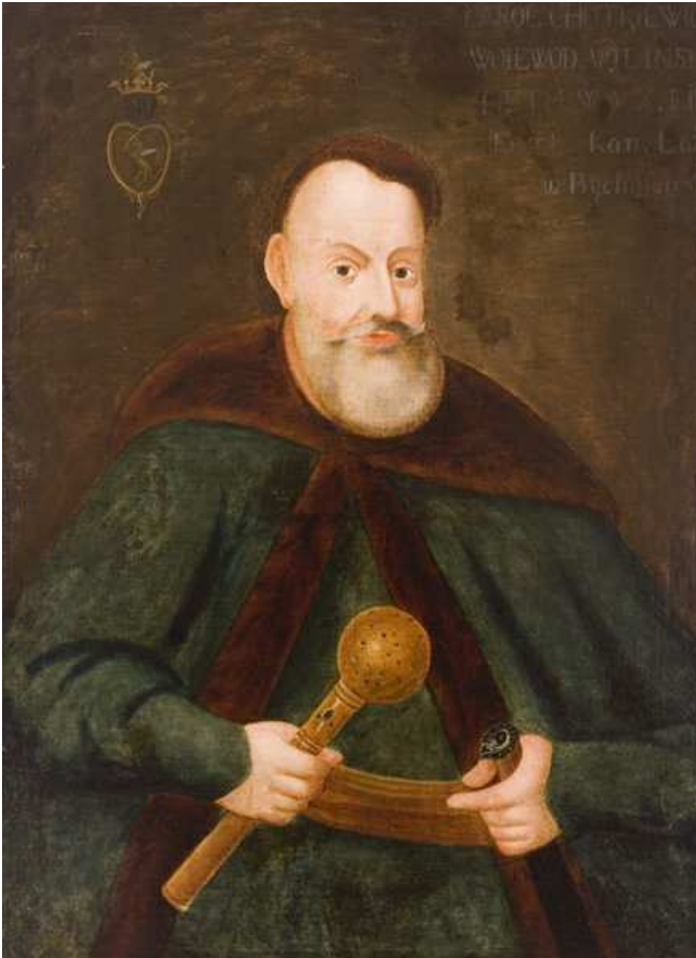
LDK etmonas, Vilniaus vaivada Jonas Karolis Chodkevičius / Nežinomas Lietuvos XVIII a. dailininkas. - XVII a.

(mirė 1621 m. rugsėjo 24 d. Chotino pilyje Ukrainoje)