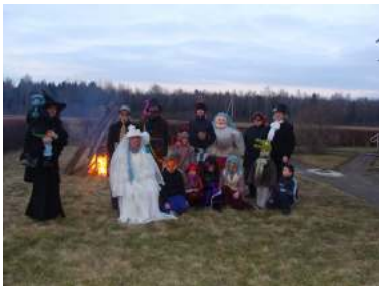
Užgavėnės Šukės kaime, 2014 m.