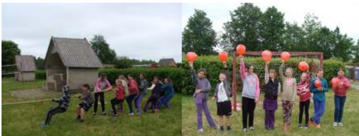
Kasmet švenčiama Tarptautinė vaikų gynimo diena, 2014 m.