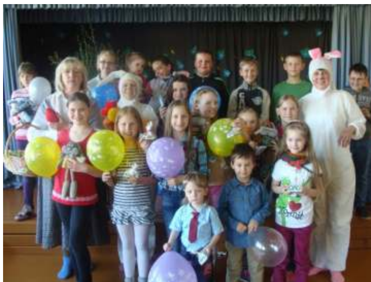
Vaikai tikrai nepamirš kasmet švenčiamos Atvelykio šventės, 2014 m.