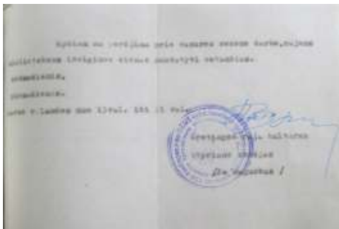
1969 m. fragmentas iš Šukės fil. archyvo, 2014 m.

1969 m. „Šukės gaunamų raštų bylos“ liudija, kad vasaros darbo valandos bibliotekose buvo nuo 13.00 iki 21.00 valandos. 37