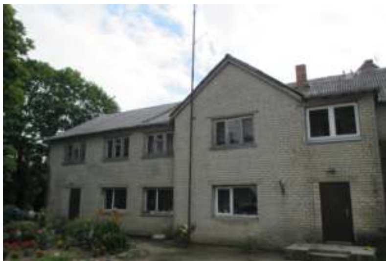
Buvęs Čyžo dvaras šiandien, 2014 m.