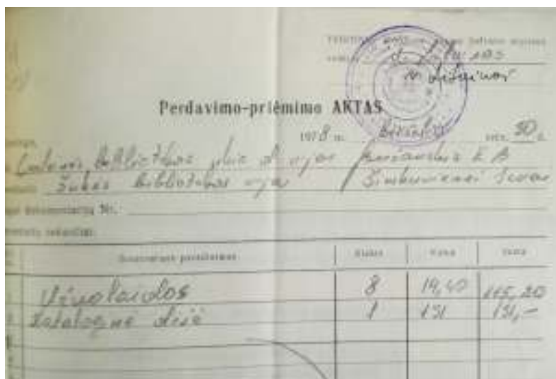
1978 m. perdavimo-priėmimo akto įrašo fragmentas, iš Šukės fil. archyvo.