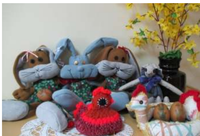
Vaikų rankdarbių paroda „Su kraite margučių, atskuba Velykų zuikučiai“