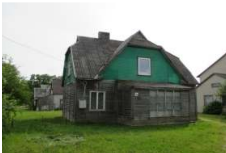
Šiame name Čyžo gatvėje, 1978-1988 m. veikė biblioteka, 2014 m.