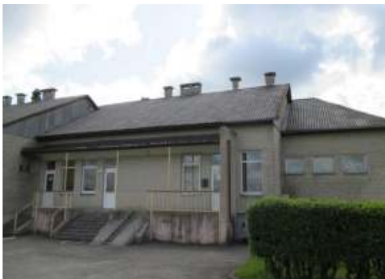
Nuo 1988 m. iki šių dienų biblioteka yra buvusiam Šukės pradinės mokyklos pastate, 2014 m.

Nuo 1987 m. atsisakyta penkmetinių darbo planų ir darbas organizuojamas tik remiantis metiniais planais. 52