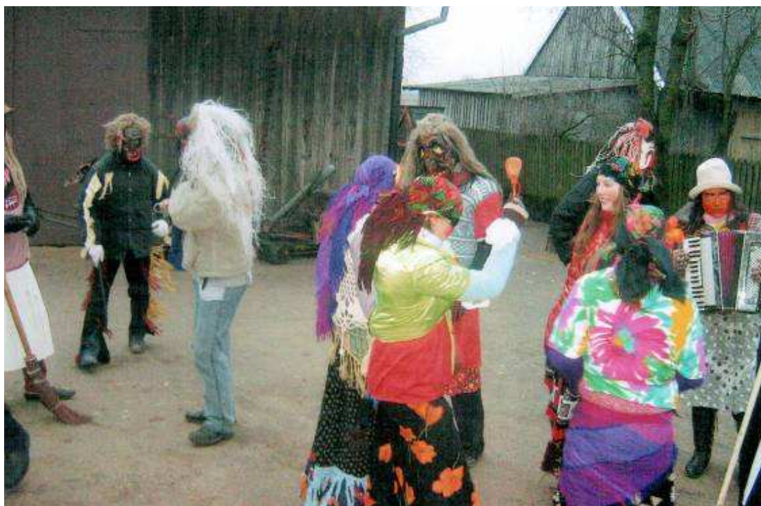
Muzikantai užgroja maršą, 2008 m.

O kur dar raganos, kitos pabaisos, žydai, velniai visokiausi, o kur lašininis su kanapiniu ir, žinoma, muzikantų būrys. Persirengėliai kiekviename kieme šoka, dainuoja, daug triukšmo sukelia.