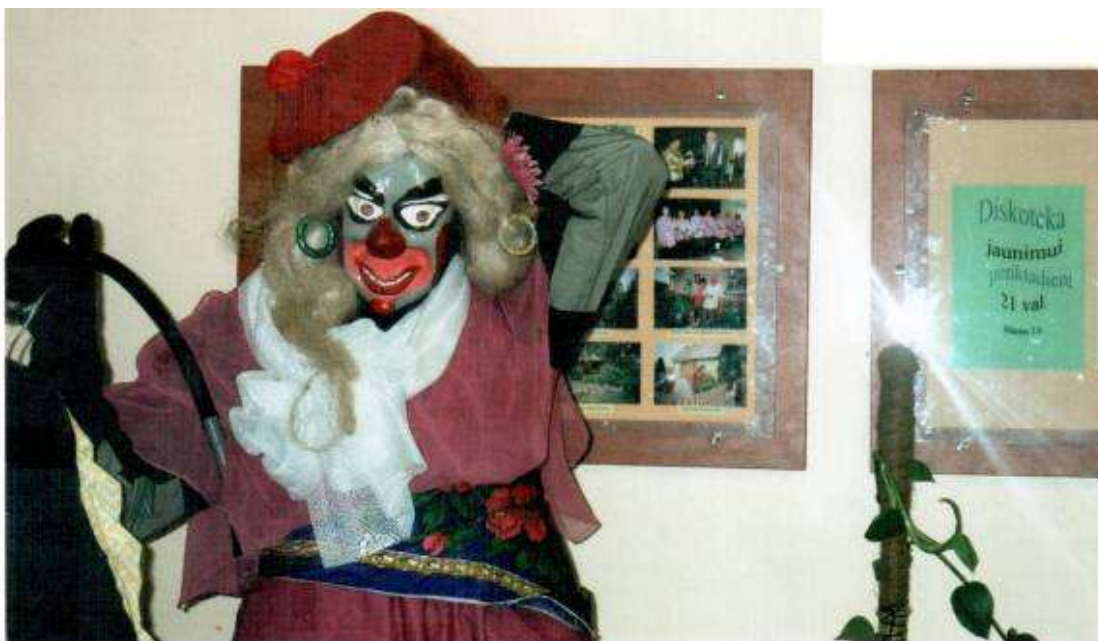
„Stiliaga“, 2007 m.

Smertis su dalgiu švaistosi, grasina visus papjausiąs. „Stiliaga“ prieš visus maivosi, kraiposi, stengiasi visus raudonais lūpdažiais išteplioti, jaunos bernus sugundyti.