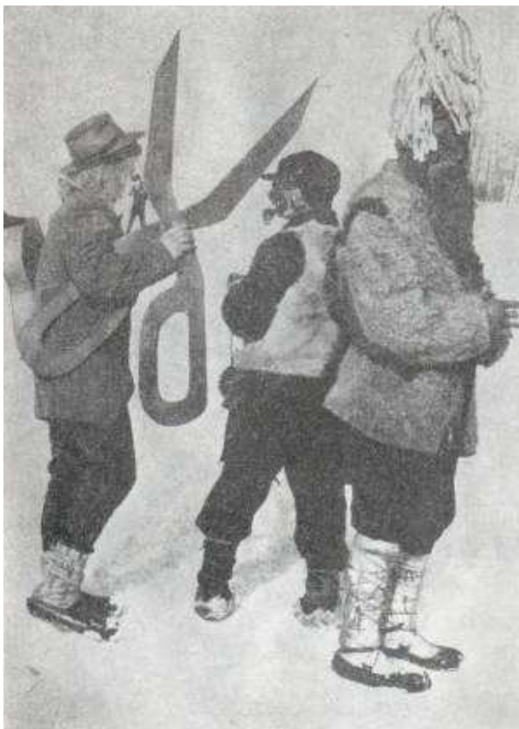
Užgavėnių persirengėliai Grūšlaukės kaime.

Eitynėse dalyvavo ir eiliniai žydai: ragana, pijokas, velnias ir kiti. Jie visi kiek išgalėdami šoko, dainavo. Pora eilinių žydų traukė pavažą su More.