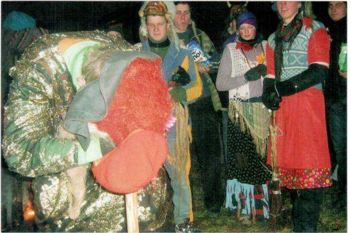
Vakare grūšlaukiškiai renkasi prie laužo, 2008 m.

Užgavėnės vadinamos slenksčiu tarp nueinančios žiemos ir ateinančio pavasario, jos laikomos pavasario pradžia, kurią stengiamasi paspartinti linksmu, išmoningu karnavalu.