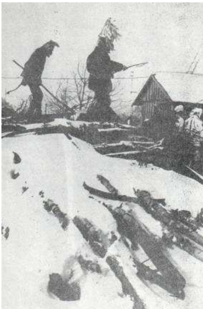
Užgavėnių persirengėliai Grūšlaukės kaime.