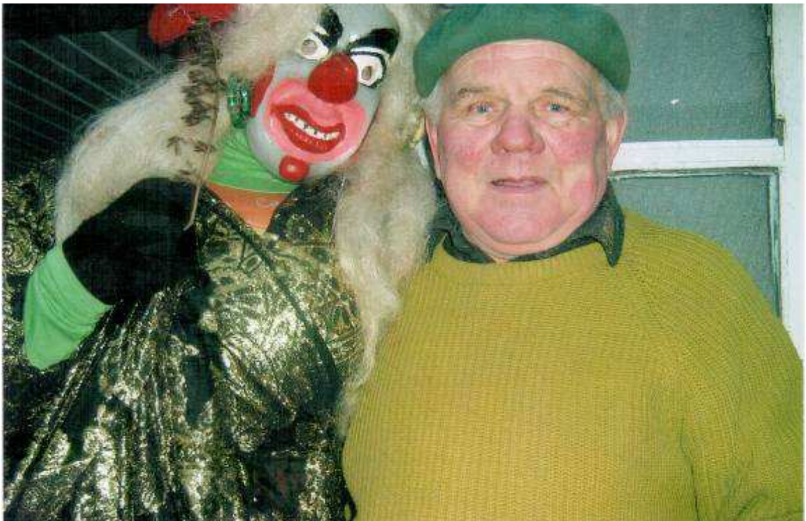
Grūšlaukiškiai žydu laukia ir maloniai juos priima, 2008 m.

Nė vienas neišleidžia ko nors kelionei neįdėjęs – kas pinigėlių, kas spurgą, o kas – ir dar ką.