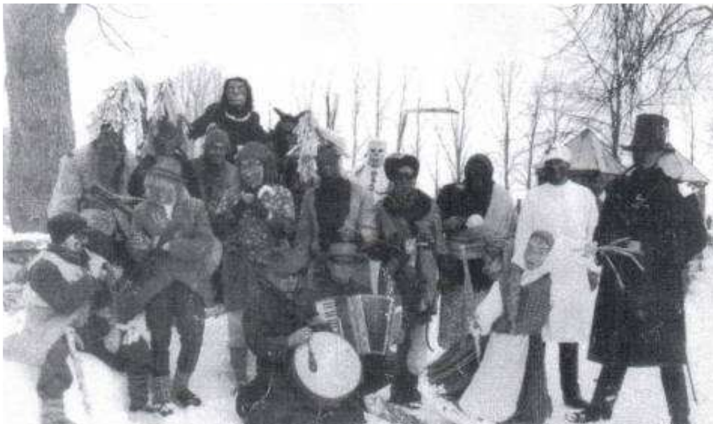
Užgavėnės Grūšlaukėje 1964 m.