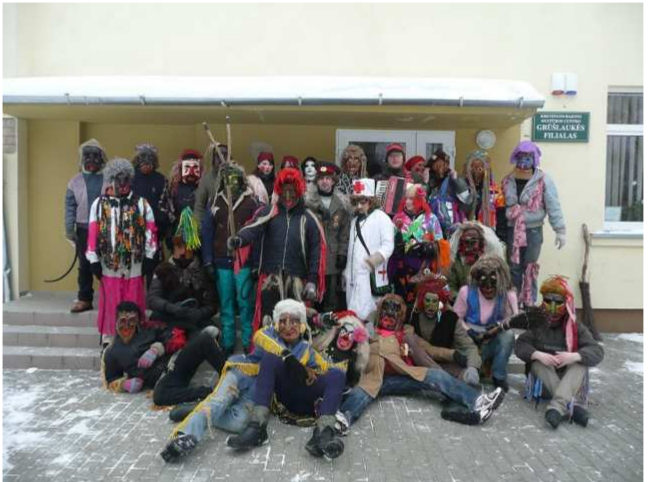
Grūšlaukės kaimo Užgavėnių „žydai“, 2007 m.

Grūšlaukės žmonės, kurių šiandien kaime skaičiuojama iki 600, nuo seno garsėja čia vis dar puoselėjamomis Užgavėnių tradicijomis.