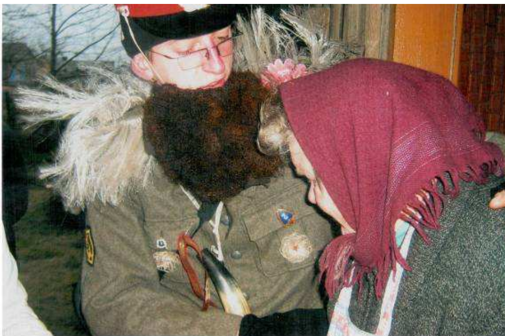
Būrio vadas – nežinia kokios armijos karininkas, 2008 m.

Būrio vadas – tradiciškai nežinia kokios armijos ordinuotas karininkas, jo dešinioji ranka – daktaras. Jis kiekvieno kiemo šeimininkui įpila „pipirinės“ mikstūros nuo visokiausių esamų ir nesamų ligų, nuo širdgėlos ir negandų.