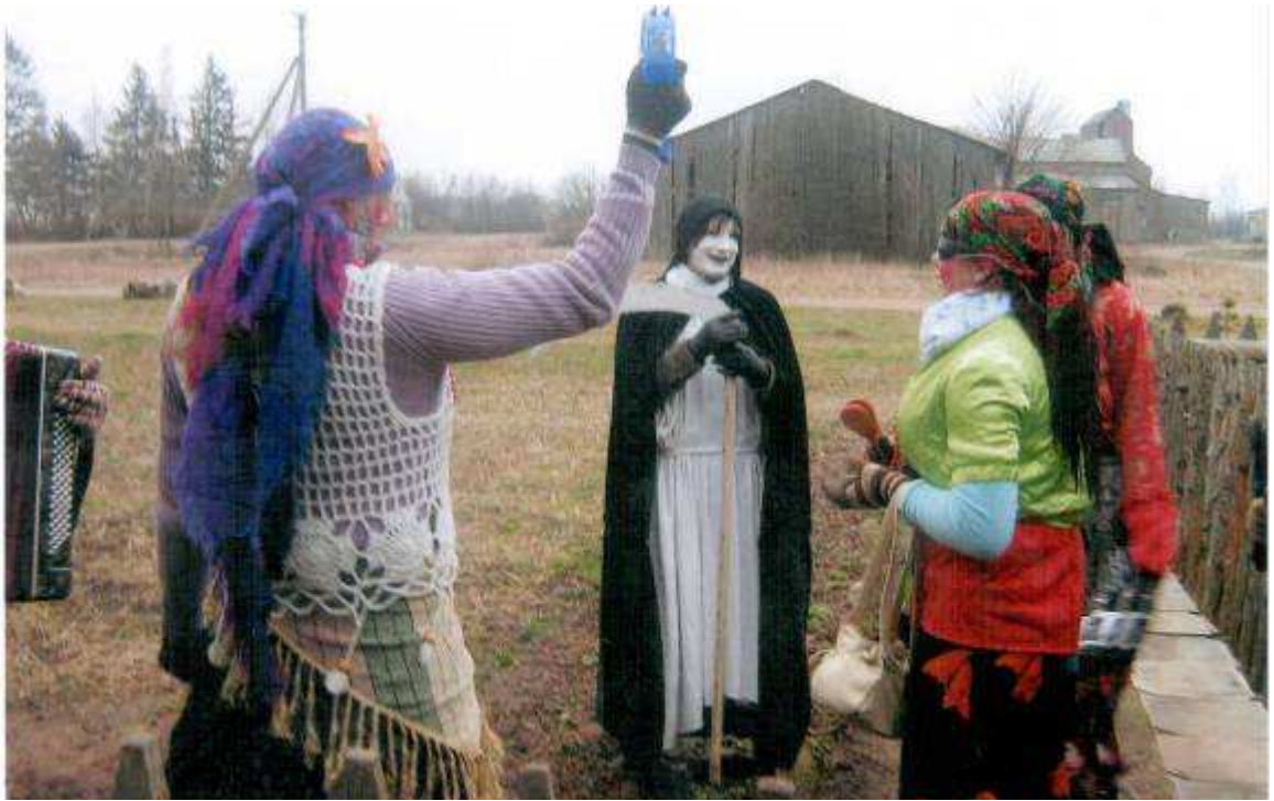
Kiekviename kieme šoka, dainuoja, daug triukšmo sukelia, 2007 m.

Ir taip visą dieną iki pat vėlyvo vakaro. Visam tam šurmuliui vadovauja Kretingos kultūros centro Grūšlaukės filialo vedėja Genutė Viskontienė.