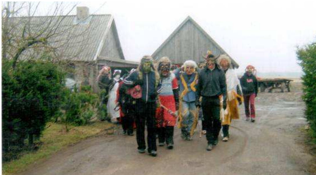
Šėlionės po kaimą, 2008 m.

Antradienio ryte Grūšlaukės jaunimas, sykiu su kultūros centro bei pagrindinės mokyklos bendruomene, pradeda šėliones po kaimą, iš eilės į kiekvieną kiemą.