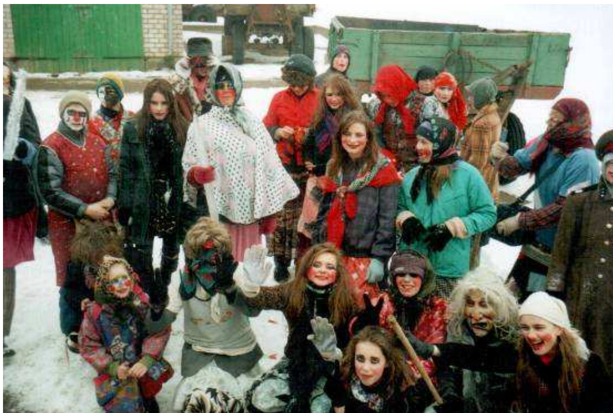
Žydeliais eina Grūšlaukės pagrindinės mokyklos mokiniai, 2007 m.

Pirmadienį žydeliais eina Grūšlaukės pagrindinės mokyklos mokiniai ir mokytojai, o vakare – ubagai. Eina didesniais ar mažesniais būriais, eina ir pavieniui.